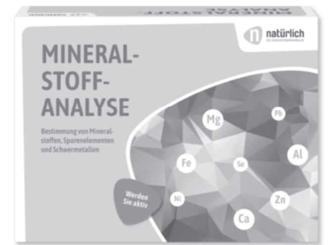
Bei der Mineralstoff-Analyse handelt es sich um eine schulmedizinisch nicht anerkannte Diagnosemethode.

Im Speziallabor bestimmen wir Mineralstoffe, Spurenelemente und Schwermetalle in den Haaren für Sie – inkl. umfangreicher Beratung zum Analyseergebnis.